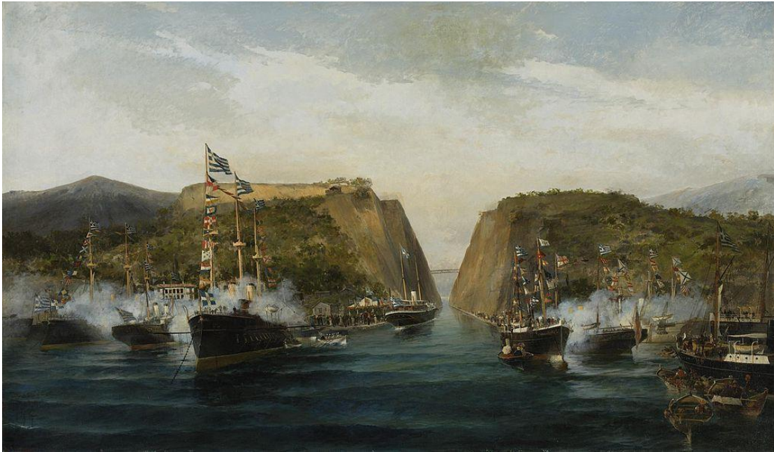
Τα εγκαίνια της Διώρυγος της Κορίνθου, Κωνσταντίνος Βολανάκης , (1893)

Γεννήθηκε στο Μεσολόγγι το 1788 και ήταν γόνος της εύπορης ομώνυμης οικογένειας των της περιοχής. Πατέρας του ήταν ο Ιωάννης Τρικούπης και μητέρα του η Αλεξάνδρα Παλαμά.