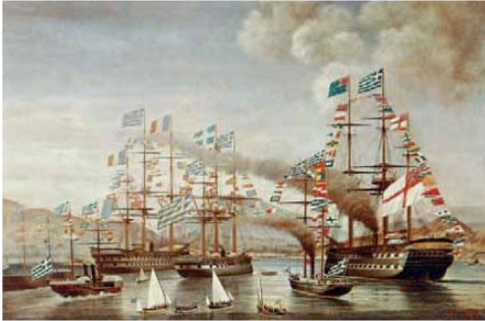
A. Κριεζής, Η άφιξη του Γεώργιου στην Ελλάδα, 17 Οκτωβρίου 1863.

Από την έξωση του Όθωνα (1862) έως το κίνημα στο Γουδί (1909)