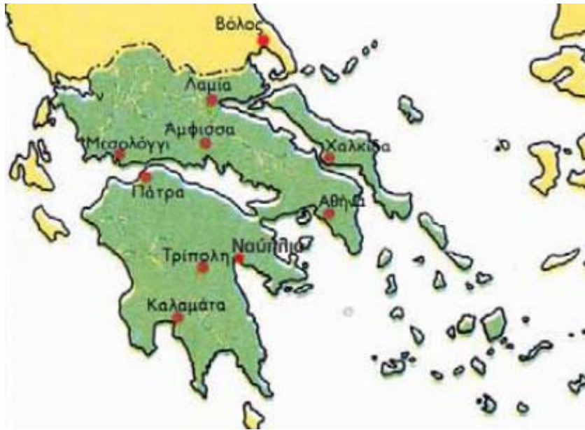
2. Το ελληνικό κράτος σύμφωνα με τη συνθήκη της Κωνσταντινούπολης (1832).

Εκπαίδευση Μια από τις κύριες προτεραιότητες του Κυβερνήτη υπήρξε η οργάνωση της εκπαίδευσης. 1) Ίδρυσε το Ορφανοτροφείο της Αίγινας , στο οποίο λειτούργησαν 2) τρία αλληλοδιδασκτικά σχολεία (αντίστοιχα των σημερινών δημοτικών αλλά τετραετούς φοίτησης), 3) τρία ελληνικά (αντίστοιχα των σημερινών γυμνασίων με τριετή φοίτηση), 4) αρκετά χειροτεχνεία (επαγγελματικές σχολές), καθώς και το 5) Πρότυπον Σχολείον , στο οποίο σπούδαζαν όσοι προορίζονταν για δάσκαλοι στα αλληλοδιδασκτικά. Επίσης, ιδρύθηκε το 6) Κεντρικόν Σχολείον , στο οποίο φοιτούσαν όσοι προορίζονταν για σπουδές σε πανεπιστήμια του εξωτερικού. Επιπλέον, δημιουργήθηκε στην Τίρυνθα (περιοχή ανάμεσα στο Άργος και το Ναύπλιο) 7) το Πρότυπον Αγροκήπιον (γεωργική σχολή).