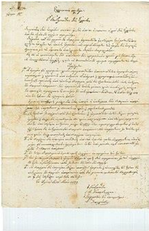
Ψήφισμα του Ιωάννη Καποδίστρια, Ιστορικό Αρχείο Ευγενίας Αντωνίου