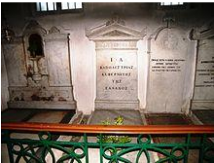
τάφος του αδελφού του, Αυγουστίνου .

Άγαλμα του Ιωάννη Καποδίστρια στην οδό Πανεπιστημίου, φιλοτεχνημένο