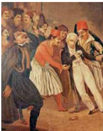
3. Η δολοφονία του Καποδίστρια (πίνακας λαϊκού ζωγράφου).

Το ελληνικό κράτος θα περιελάμβανε τη Στερεά Ελλάδα, την Πελοπόννησο, τα νησιά του Αργοσαρωνικού, την Εύβοια, τις Κυκλάδες και τις Σποράδες.