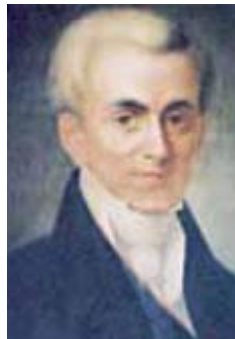
1. Ιωάννης Καποδίστριας

Η ολοκλήρωση της ελληνικής επανάστασης (1829)