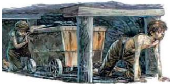
Παιδική εργασία σε ανθρακωρυχείο την εποχή της βιομηχανικής επανάστασης.