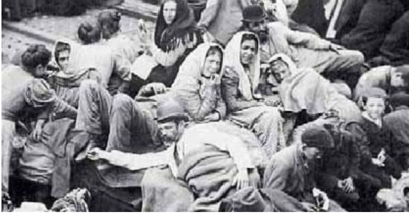
1. Μετανάστες στο κατάστρωμα πλοίου ταξιδεύουν προς την Αμερική